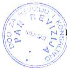
Matin Tibor Ovlašćeni revizor Pan Revizija d.o.o. Novi Sad