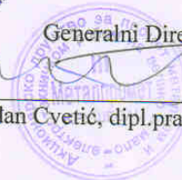
Srđan Cvetić, dipl.pravnik