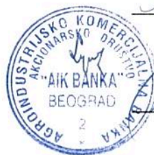
Dejan Vasić, član