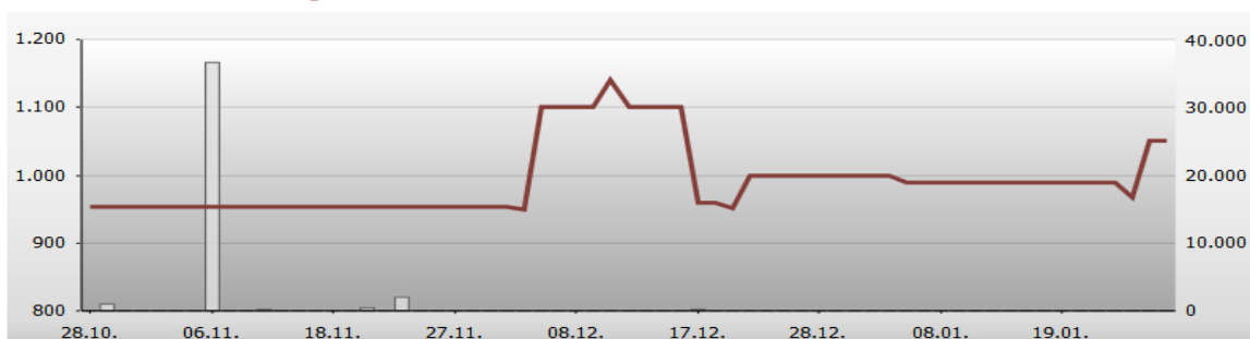
AIKBPB - AIK banka a.d. , Beograd

Aik banka a.d. Niš – prioritetne konvertibilne akcije bez prava glasa