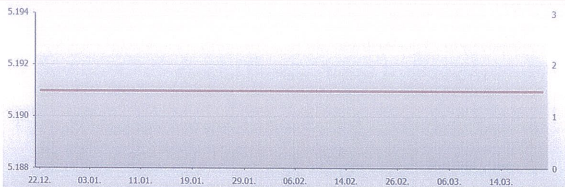
ENGR - Energoprojekt garant a.d. , Beograd