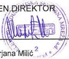
Mirjana Milić 2